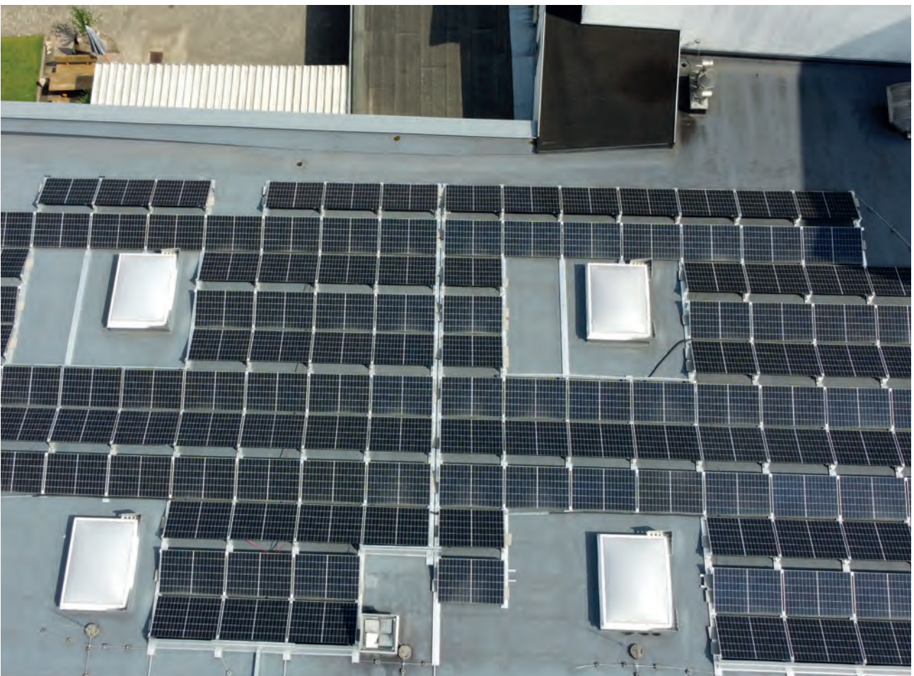
Investitionsprojekte Heißwasser-Reservetank, Trebersilo und Solaranlage.