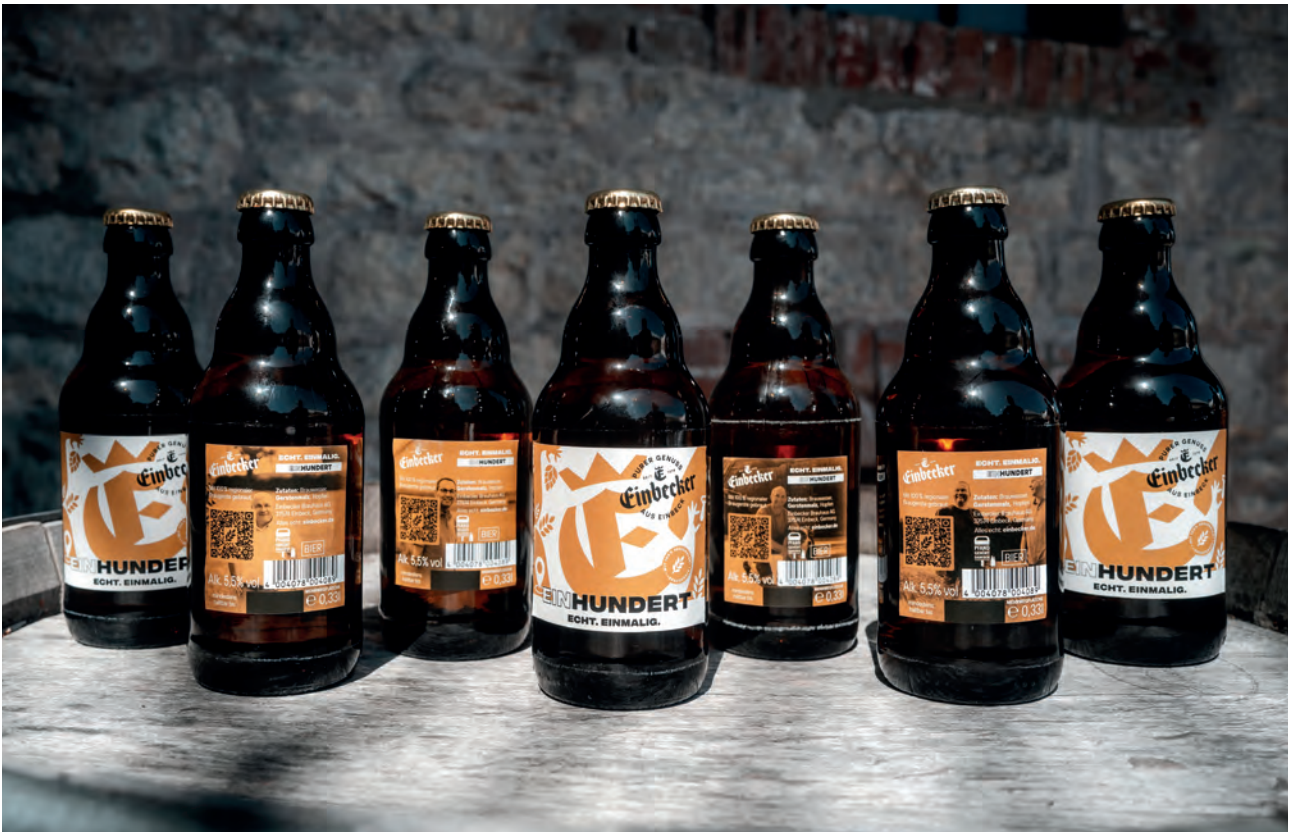
„Einbecker 100“ – das Bier mit 100 % Malz aus heimischer Braugerste

Durch striktes Kostenmanagement, umgesetzte Restrukturierungsmaßnahmen und der Portfolio-Neuausrichtung bestehen aktuell keine Anhaltspunkte, die den Fortbestand der Einbecker Brauhaus AG gefährden