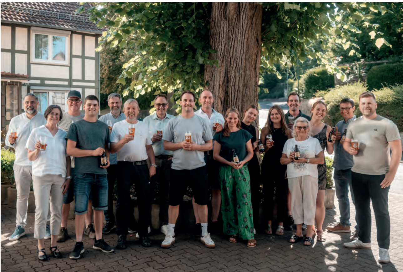
Erstverkostung „Einbecker 100“ durch die beteiligten Landwirte des Projektes „Regionale Braugerste“