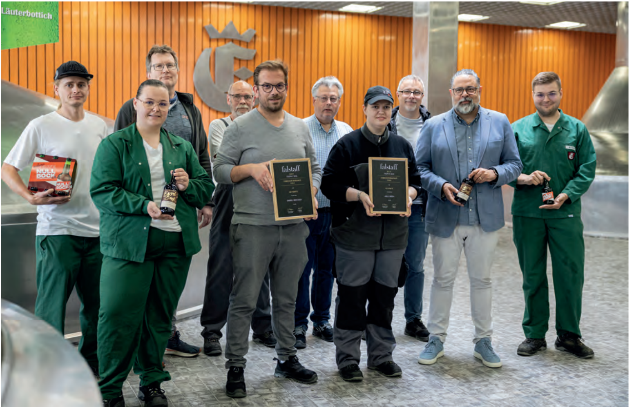
Gewinner der Falstaff-Biertrophy 2025 „Einbecker Barrel Bock“ und „Einbecker Null Bock“